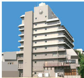
高知プリンスホテル