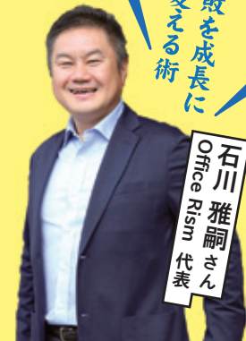
ジョブカフェ高知主催「新社会人のためのスタートダッシュセミナー」講師(令和元年6月実施)