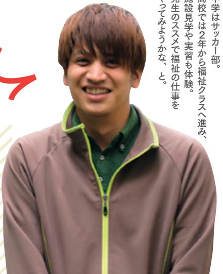
中学はサッカー部。高校では2年から福祉クラスへ進み、施設見学や実習も体験。先生のススメで福祉の仕事をやってみようかな、と。

職員同士、利用者の方、どちらとも楽しい関係であることが、仕事のモチベーションにもつながります。コミュニケーションが苦手でも、どんな話題でもいいので会話をすることが大事です。