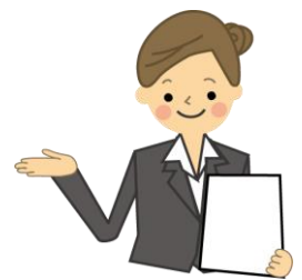
講師: キャリアコンサルタント 門脇 由紀子