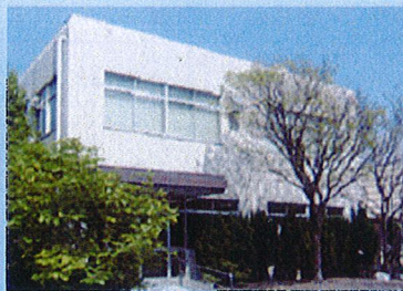
仁井田工場・開発研究所