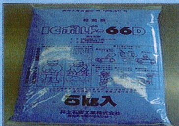
殺菌剤(ペースト状ボルドー液)