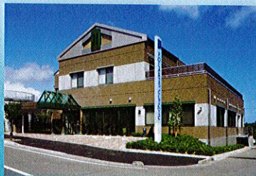
施工例:みなみが丘ポラリスクリニック