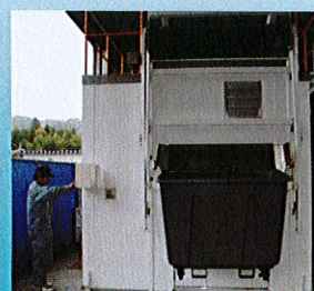
医療廃棄物処理システム STE100