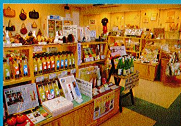
ガーデンショップnonoca-野の花-